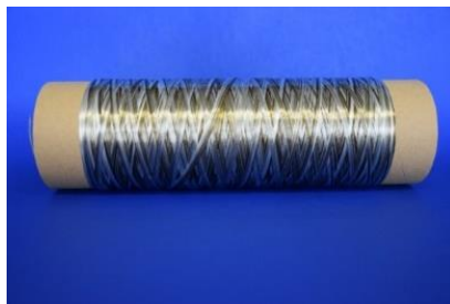
Hybridrovingspule / hybrid roving coil