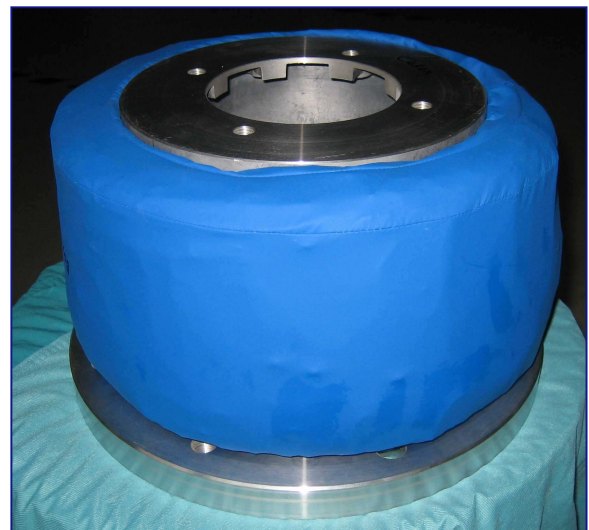
Pumpenträger mit schallisolierender Nachrüstvariante Pump support with a sound-absorbing retrofitting variant

The textile components can be manufactured in various dimensions and are of interest for pump supports already in use as well as a new complete solution. The use of the sleeves makes sense for other noise protection measures, too.