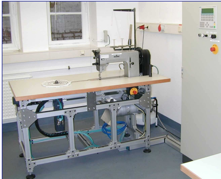
Ansicht der Näheinrichtung; Nähgut in Wechselposition

Die Programmierbare Rundnäheinrichtung PRN 500 wurde speziell für das Nähen schwerer scheibenförmiger Textilien entwickelt. Sie besteht aus dem Nähkopf, einer handelsüblichen schweren 1-Nadel-Doppelsteppstichnähmaschine, und einer zusätzlichen Nähgutführungseinrichtung.