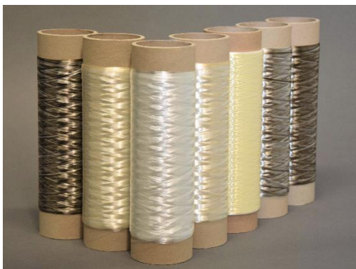
Hybridrovingspule / hybrid roving coil