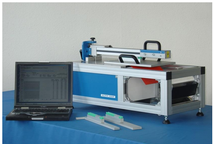
ACPM 200P mit PC (Option)