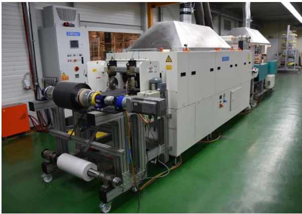
Faserfolienanlage FFA 600 / Fiber film system FFA 600

Entwicklung einer Anlage zur kostengünstigen, kontinuierlichen Herstellung von endlosfaserverstärkten, unidirektionalen thermoplastischen (und duroplastischen) Prepregs