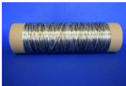
Hybridrovingspule / hybrid roving coil